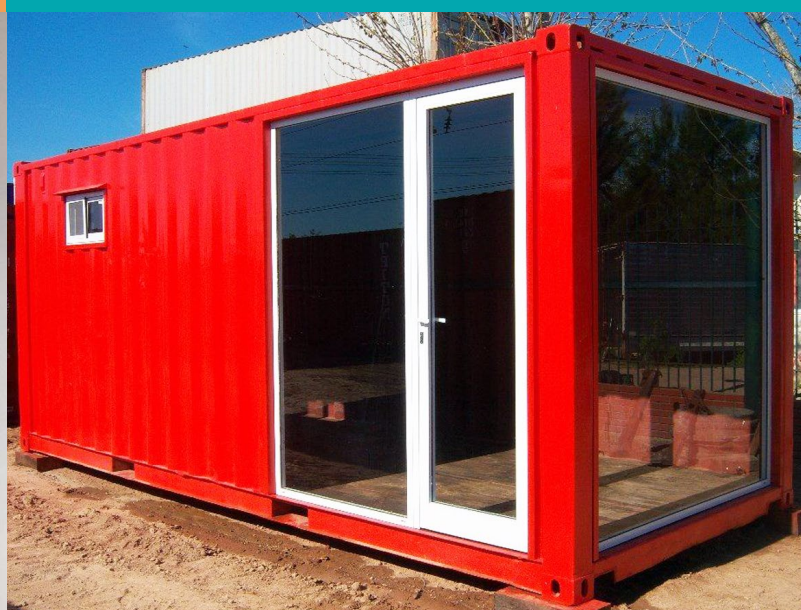
SALA DE VENTA