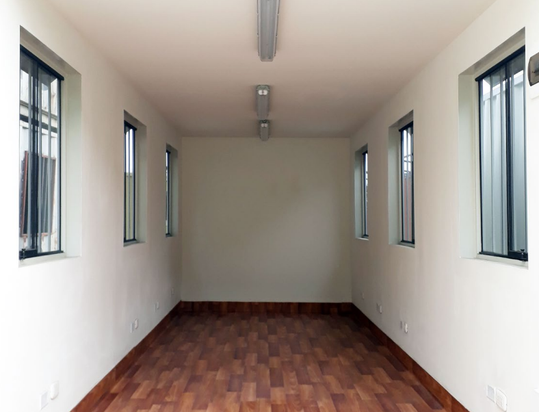
SALA DE REUNIONES